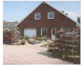
Dat Blömenhus Ochtersum Esenser Str. 90 26489 Ochtersum Telefon: 04975/1793