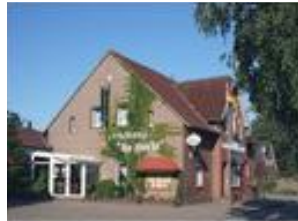
Landhaus Up Höcht Alte Dorfstr. 3 26553 Roggenstede Telefon: 04933/778