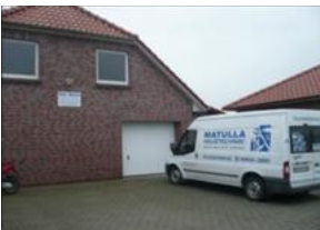
Matulla Haustechnik GmbH Osterhammer 10 26553 Roggenstede Telefon: 04933/2293