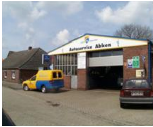
Autoservice Abken Am Blink 15 26553 Westeraccum Telefon: 04933/8213