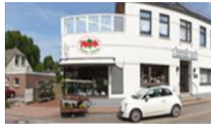
Onno Haak GmbH Bestattungsinstitut Anton-Esen-Str. 3 26427 Esens Telefon: 04971/4110