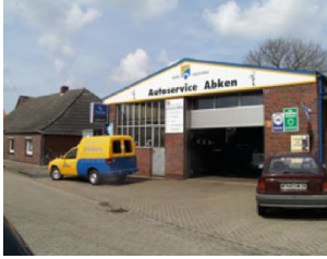
Autoservice Abken Am Blink 15 26553 Westeraccum Telefon: 04933/8213