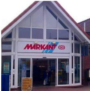
Markant Weyerts Störtebeker Str. 148 26553 Westeraccumersiel Telefon: 04933/500