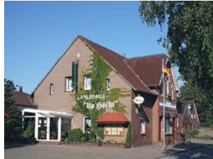
Landhaus Up Höcht Alte Dorfstr. 3 26553 Roggenstede Telefon: 04933/778