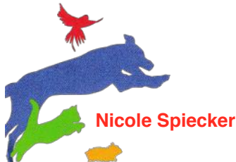
Piepmatz Futtershop Tiernahrung-Angelköder-Zubehör Pumpsielerstraße 11 26553 Westerbur Telefon: 0162/6608631 piepmatz-futtershop@gmx.de www.piepmatz-futtershop.de

Möchten Sie Unterstützer werden? Auskunft bei Ihrem Kirchenvorstand.