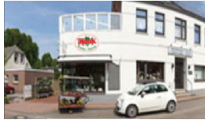
Onno Haak GmbH Bestattungsinstitut Anton-Esen-Str. 3 26427 Esens Telefon: 04971/4110