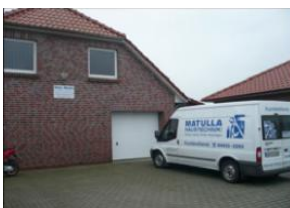
Matulla Haustechnik GmbH Osterhammer 10 26553 Roggenstede Telefon: 04933/2293