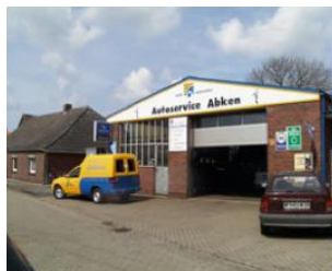
Autoservice Abken Am Blink 15 26553 Westeraccum Telefon: 04933/8213