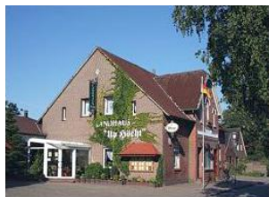
Landhaus Up Höcht Alte Dorfstr. 3 26553 Roggenstede Telefon: 04933/778