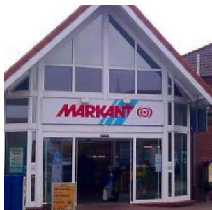
Markant Weyerts Störtebeker Str. 148 26553 Westeraccumersiel Telefon: 04933/500