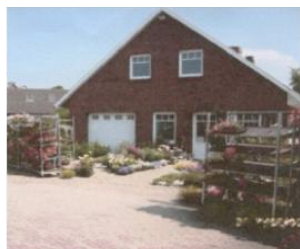
Dat Blömenhus Ochtersum Esenser Str. 90 26489 Ochtersum Telefon: 04975/1793