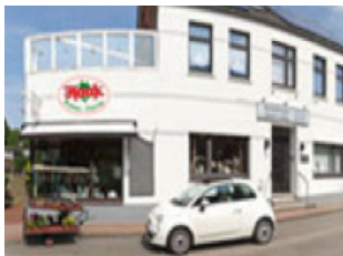
Onno Haak GmbH Bestattungsinstitut Anton-Esen-Str. 3 26427 Esens Telefon: 04971/4110