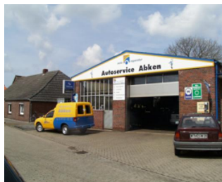
Autoservice Abken Am Blink 15 26553 Westeraccum Telefon: 04933/8213